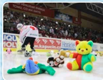
Na ledové ploše přistálo 437 plyšáků všeho druhu, děkujeme!

Dárky všeho druhu – panenky, autíčka, stavebnice, knížky, stolní hry, ale i oblečení aj. - byly osobně předány dětem z dětského domova v Náměšti nad Oslavou a Hrotovicích, které se utkání osobně účastnily. Děti dostaly dárky v průběhu druhé hokejové přestávky přímo na ledové ploše Zimního stadionu Města Třebíče Mann + Hummel ARENY a v daný okamžik byly „zaházené“ plyšáky všeho druhu, které přinesli a házeli fanoušci Horácké Slavie. Na ledovou plochu jich přistálo neskutečné množství 437 kusů. Všechny byly rozdány nejen zúčastněným dětem, ale i dětem v dětském domově v Jemnici, dětskému oddělení nemocnice v Třebíči a také mateřským školkám v Třebíči.